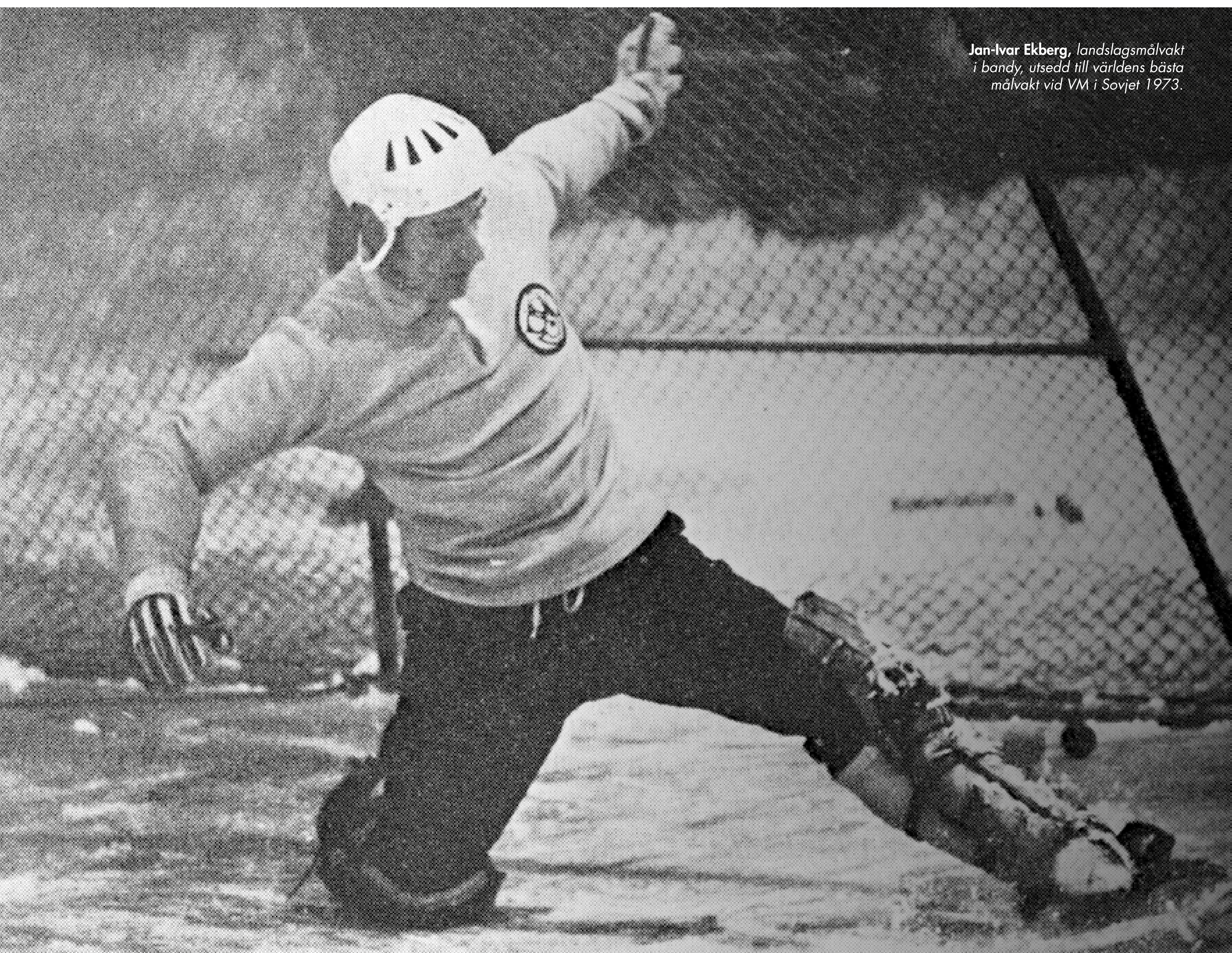
Jan-Ivar Ekberg , landslagsmålvakt i bandy, utsedd till världens bästa målvakt vid VM i Sovjet 1973.