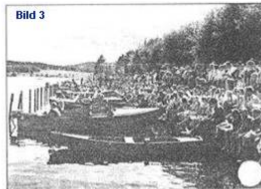
Stor publik. Under främst 50-talet drog racerbåtstävlingarna verkligen publik och det kunde komma över 6000 åskådare. De satt och stod i flera led längs Strandpromenaden.