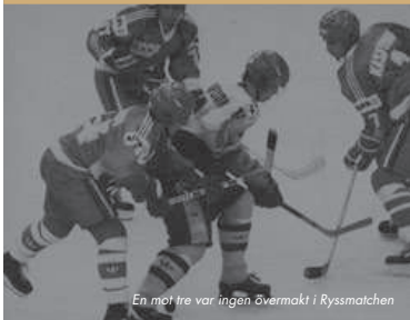
En mot tre var ingen övermakt i Ryssmatchen

Övrigt Stor Grabb, 1997 Svenska Dagbladets Guldmedalj, 2006 Konungens medalj 8:e storleken för sitt deltagande i Tre Kronor, 2007 ITA-äroshelgonetpris, 2013 invald i Svensk ishockeys "Hockey Hall of Fame". Sedan 1997 arbetar han som tränare, bl.a. för Tre Kronor 2005-2010. 2006 blev han som tränare den förste som fört ett ishockeylag till guld i både OS och VM samma säsong. 2002 ledde han Farjestad till SM-guld. Förutom tränare i Tre Kronor och Farjestad har han tränat Schweiz landslag, VEU Feldkirch, SC Langens Tigers, Akent Mylisjii, Thomas Solo Ice Tigers, SCL Tigers.