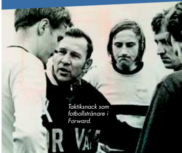
Taktiksnack som fotbollstränare i Forward.