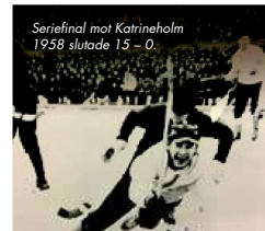
Seriefinal mot Katrineholm 1958 slutade 15 - 0.