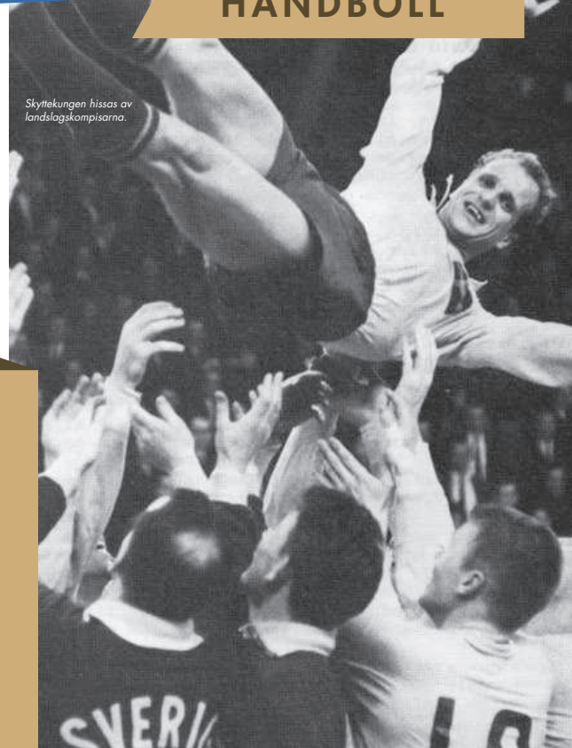
Skyttekungen hissas av landslagskompisarna.