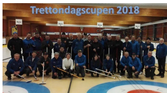
SM-Veckan år 2015 i Örebro, med curling.