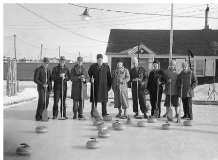
Curlingspel vid klubbstugan 1937.

var, "Där ute strid här inne frid". Varje torsdag var det klubbafton, ärtsoppa och punch serverades. Antalet medlemmar var begränsat till fyrtio.