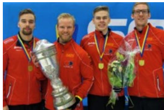
EM, VM & OS vinnarna, Lag Edin vann SM.