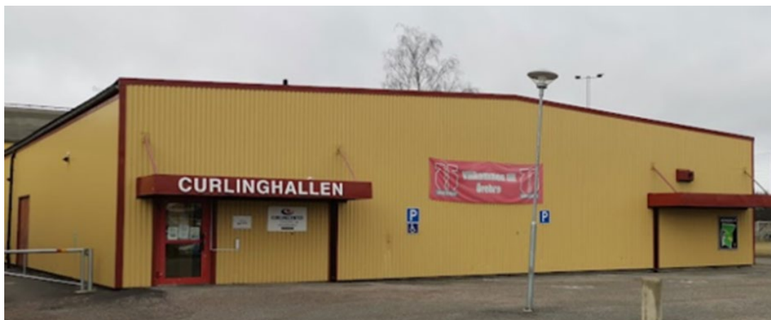
Curlinghallen – Trängen idag