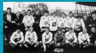
Stora silvret 1994.

Örebro SK:s herrar har vid flera tillfällen haft stora framgångar. I början av 1990-talet kvalificerade sig laget under några år till UEFA-Cupen. Laget spelade hem stora silvret i allsvenskan 1994 och lilla silvret 2010.