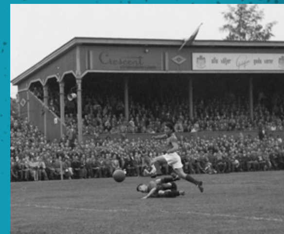
VM 1958 Frankrike-Skottland

De tre största fotbollshändelserna på arenan är; 1958 Eyravallen var värd för en VM-match i fotboll mellan Frankrike och Skottland 1990-talet - Örebro SK spelade ett antal matcher i UEFA-cupen 2015 KIF Örebro mötte Paris Saint-Germain i Champions League - 5 976 åskådare.