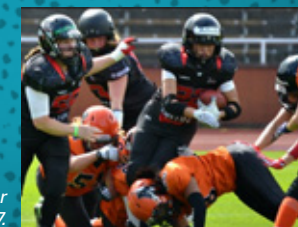
Damerna vinner SM-Guld 2017.

Örebro Black Knights har spelat hem SM-guld på arenan. Damerna 2017 samt herrarna 2021.