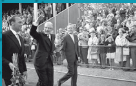
Kung Gustav VI Adolf vid Örebro 700 år

Vid invigningen var Eyravallen både en idrottsplats och ett nöjesfält. Här skedde utöver idrottande många evenemang som utställningar och konserter, en dansbana fanns.