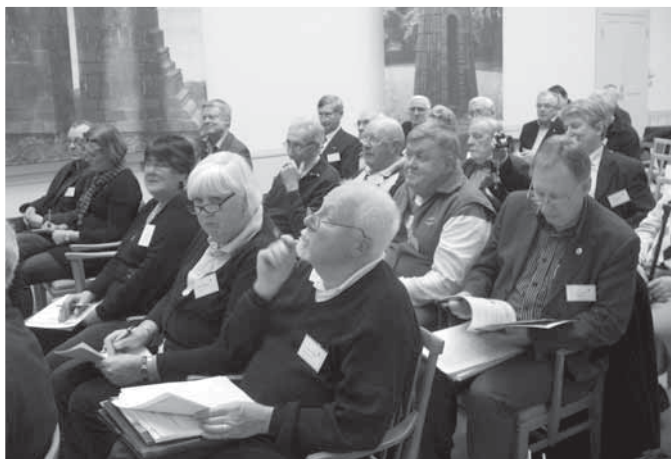
Deltagare på stämman.