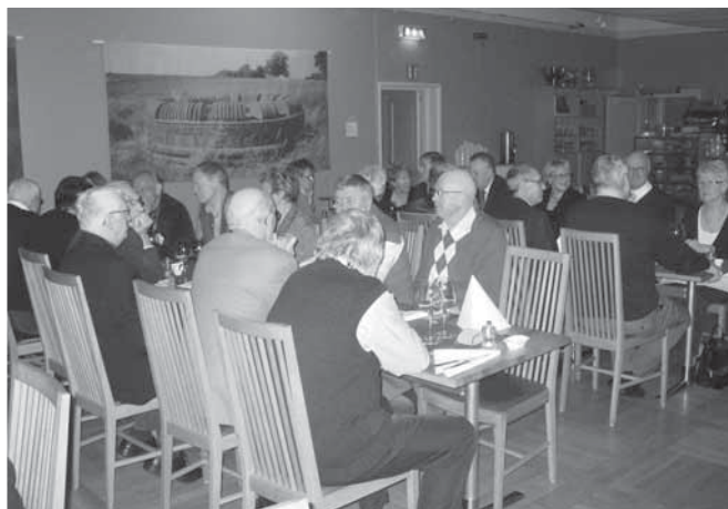
Supé på Amuse.