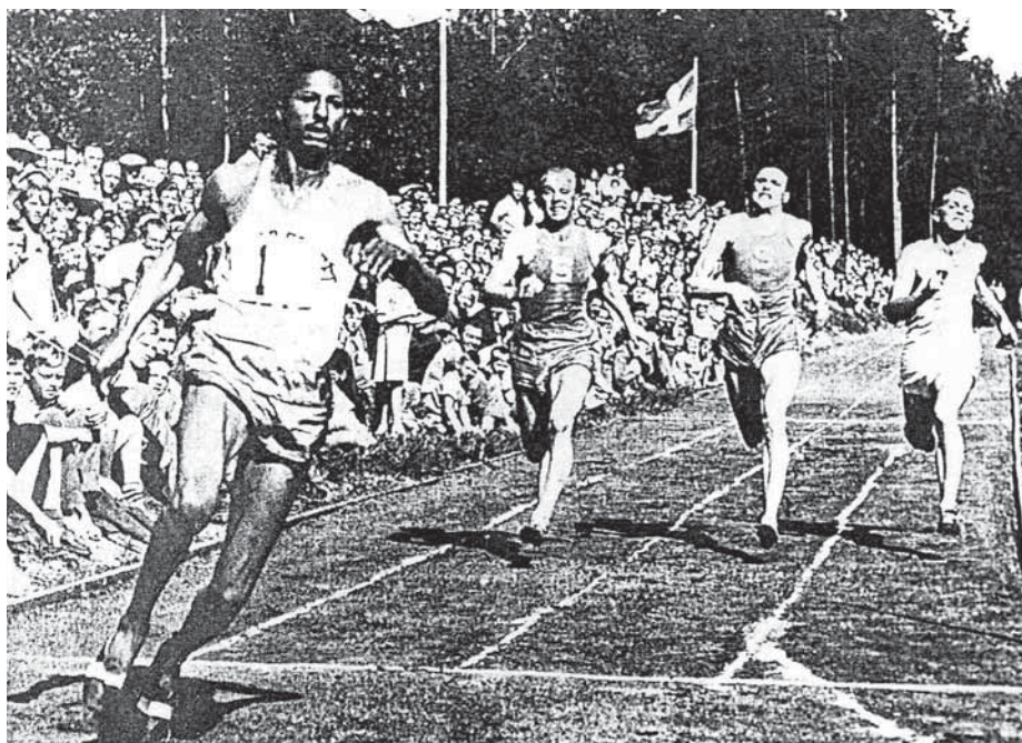
Jamaicas stjärnsprinter Herbert Mc Kenley leker hem 100 meter på 10,7 när Skölvboslätts idrottsplats återinvigdes 17 juni 1950.