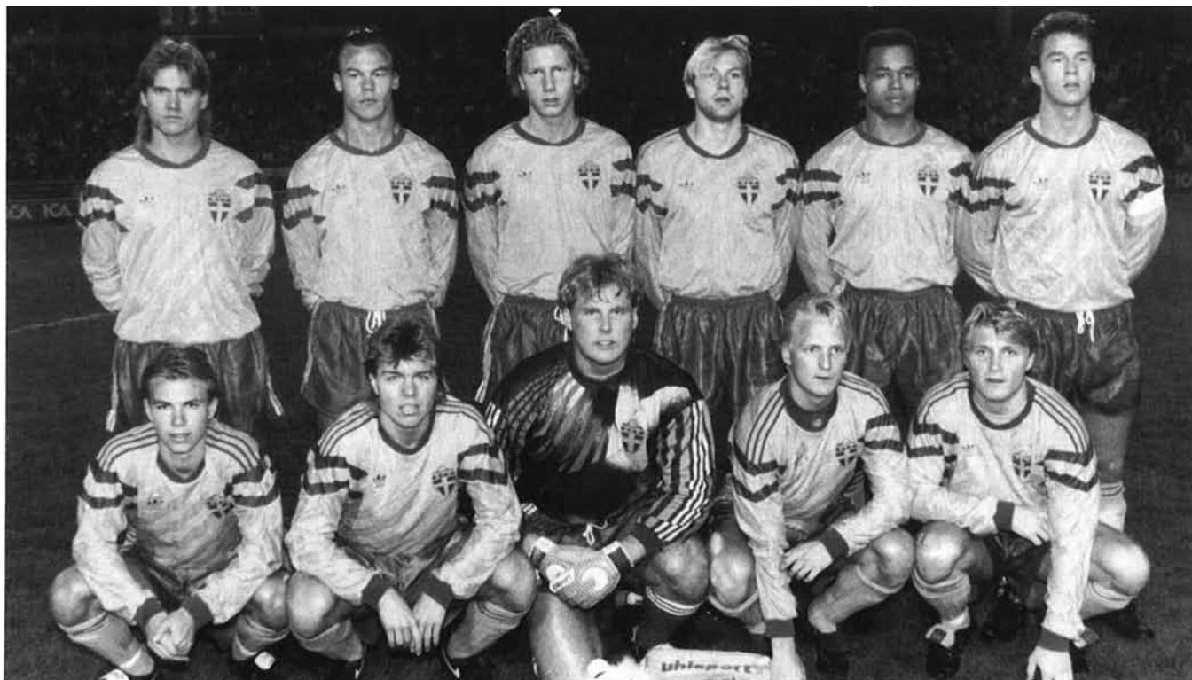
Stående fr v Jonny Rödlund, Joachim Björklund, Jesper Jansson, Håkan Mild, Filip Apelstav och Patrik "Bjärred" Andersson. Knästående Niclas Alexandersson, Tomas Brodin, Jan Ekholm, Christer Fursth och Magnus Johansson.

- I fotboll har hon tagit ryggen på Marta, säger han nöjt.