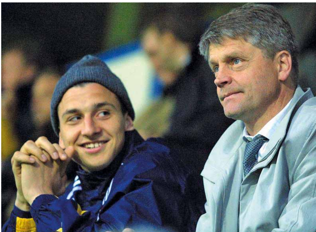
Hasse Borg och Zlatan