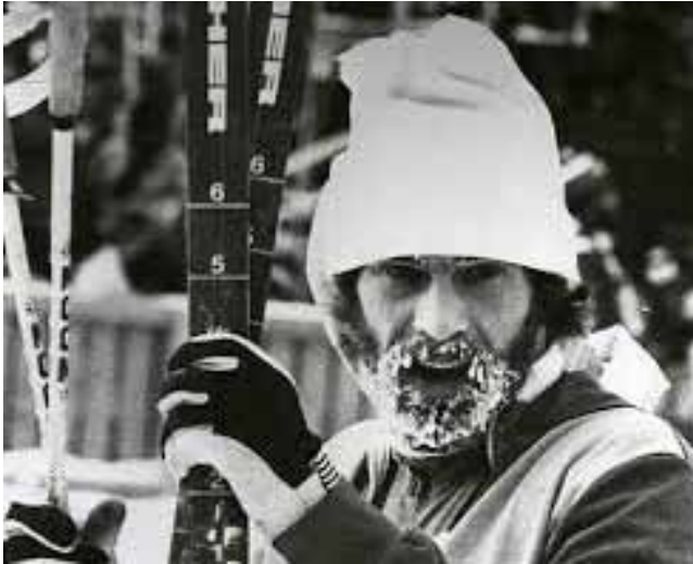
Thomas Wassberg, fyra OS-guld