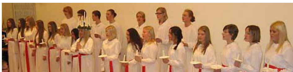
Luciatå vid Caféträffen i december