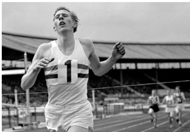
Sir Roger Bannister, förste löparen under fyra minuter på 1 engelsk mil.