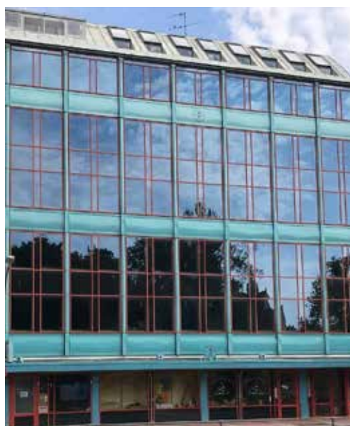
ÖLIS klubblokal, nu i Byggmästareföreningens Hus på Järntorgsgatan 3.