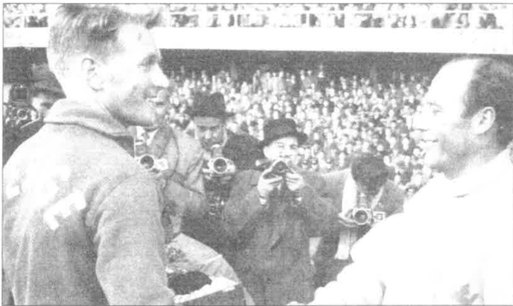
Två världsstjärnor tillsammans: Orvar Bergmark tar Guldbollen 1958 av "Il professore" Gunnar Gren.