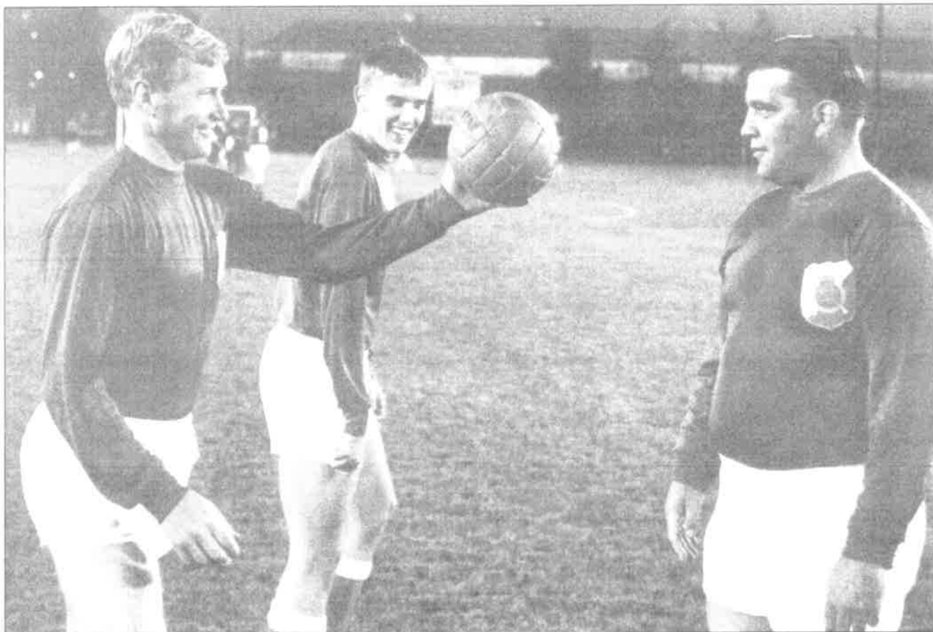
Orvar Bergmark, Thomas och Gunnar Nordahl.

Jag ber om en hälsning till familjen Bergmark och som man säger här i Frankrike "Bon courage pour l'avenir".