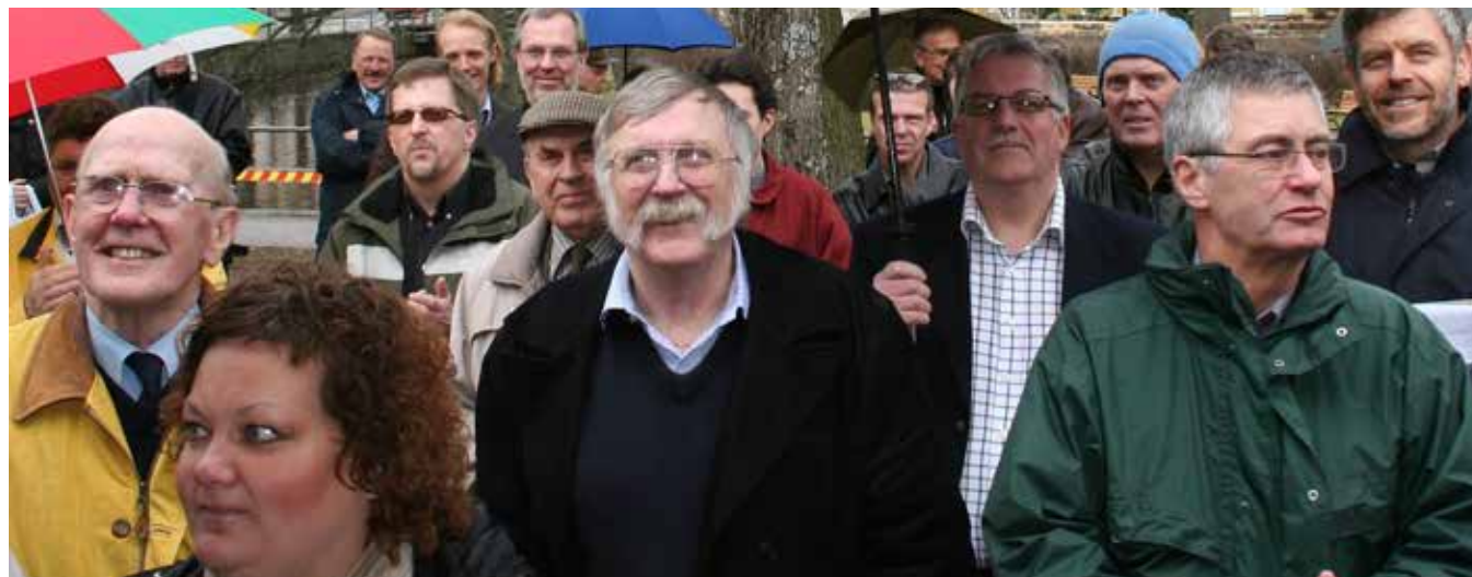
Invigning av utställningen.