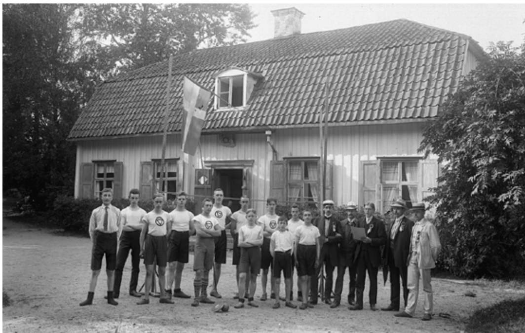
Vid bildandet 1908 skedde KFUM:s idrottsverksamhet vid det för örebroarna så välbekanta Sommarro. I det angränsande, efter brand nyuppförda, Templet säljs det idag glass.